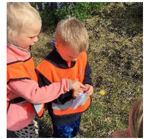
Óskaði sér að fara til útlanda og finna fjársjóð eftir korti

Söngur í sal er alltaf á föstudögum þar sem allir koma saman og syngja. Deildirnar skiptast á að stjórna söngstundinni. Börnin á Furuseli og Birkiseli velja sér lag og kynna lagið sitt sjálf. Á Víðiseli er ákveðið í samráði við börnin hvaða lög skuli sungin, en börnin kynna lögin.