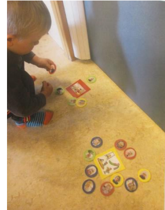
Velja um útiveru og inniveru