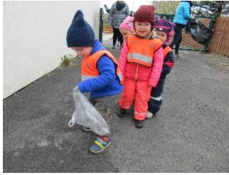
Óskaði sér þess að vera ruslamaður og týna rusl