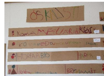
Birkisel (elsta deild)