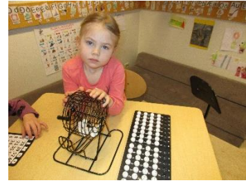
Valdi að stjórna Bingó í samverustund