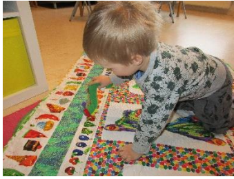
Kom með Litlu lirlfuna að heiman, teppi og bók og sýndi börnunum