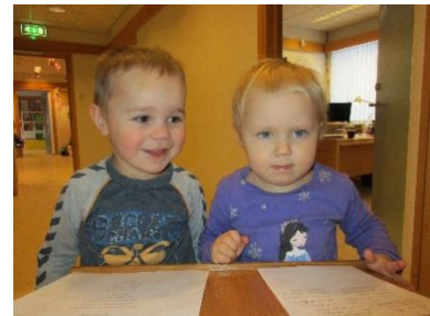
Börnin eru ekki há í loftinu þegar þau standa í púlti og kynna lögin í salnum

Söngur í sal er alltaf á föstudögum þar sem allir koma saman og syngja. Deildirnar skiptast á að stjórna söngstundinni. Börnin á Furuseli og Birkiseli velja sér lag og kynna lagið sitt sjálf. Á Víðiseli er ákveðið í samráði við börnin hvaða lög skuli sungin, en börnin kynna lögin.