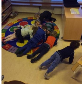
Kom með æfingar til að kenna börnunum að heiman