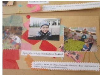
Óskaði sér að leika sér á elstu deildinni