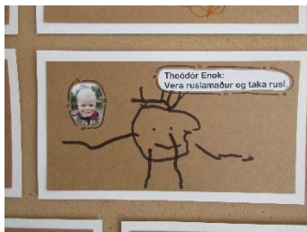
Víðisel (yngsta deild)

Að hausti setti hvert og eitt barn á Birkiseli og Furuseli fram ósk sem var uppfyllt þegar tækifæri gafst yfir veturinn. Óskirnar voru hafðar sýnilegar uppi á vegg á deildunum til þess að hægt væri að skoða þær og ræða. Á Víðiseli höfðu börnin ekki skilning á hugtakinu að óska sér fyrr en eftir áramót. Í mars þegar yngsta barnið á deildinni var orðið 2ja ára völdu börnin sér óskastein og máluðu. Þau héldu á honum í hendinni og óskuðu sér og voru óskirnar hafðar sýnilegar uppi á vegg á deildinni. Þær voru ræddar og barnið var með óskasteininum í hendinni þegar óskirnar rættist.