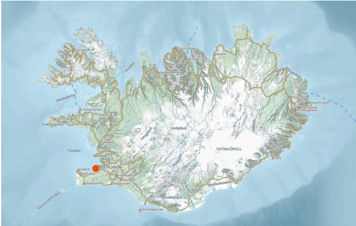
Mynd 1. Skráningarsvæðið er þar sem rauði punkturinn er.

Forsíðumynd: Loftmynd af svæðinu frá Loftmyndum ehf.