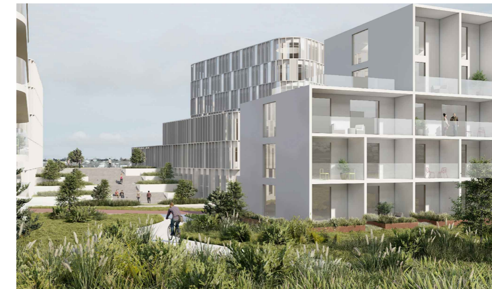
SKYRINGARMYND, HORFT I ATT AD HEILSUKLASA