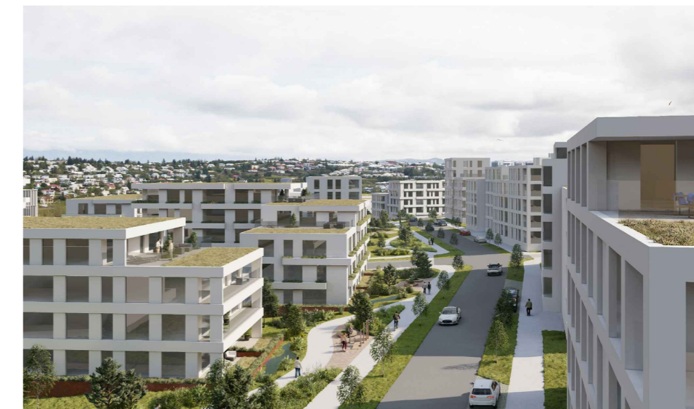
SKYRINGARMYND, HORFT YFIR GRANAN GEIRA