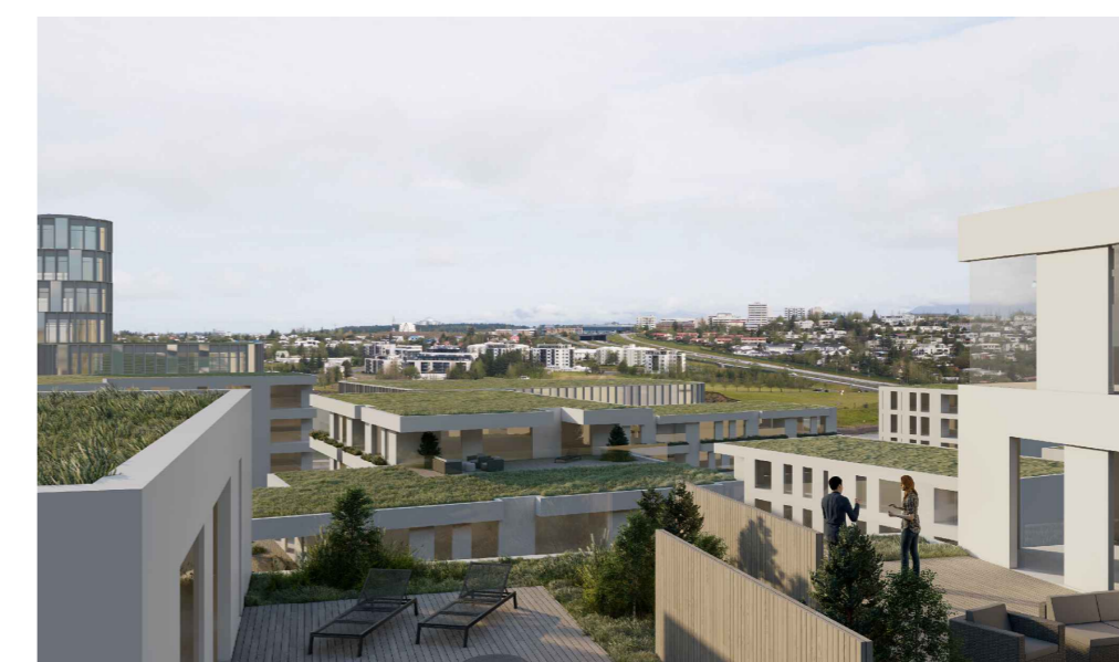
SKYRINGARMYND, UTSYNI TIL NORDURS