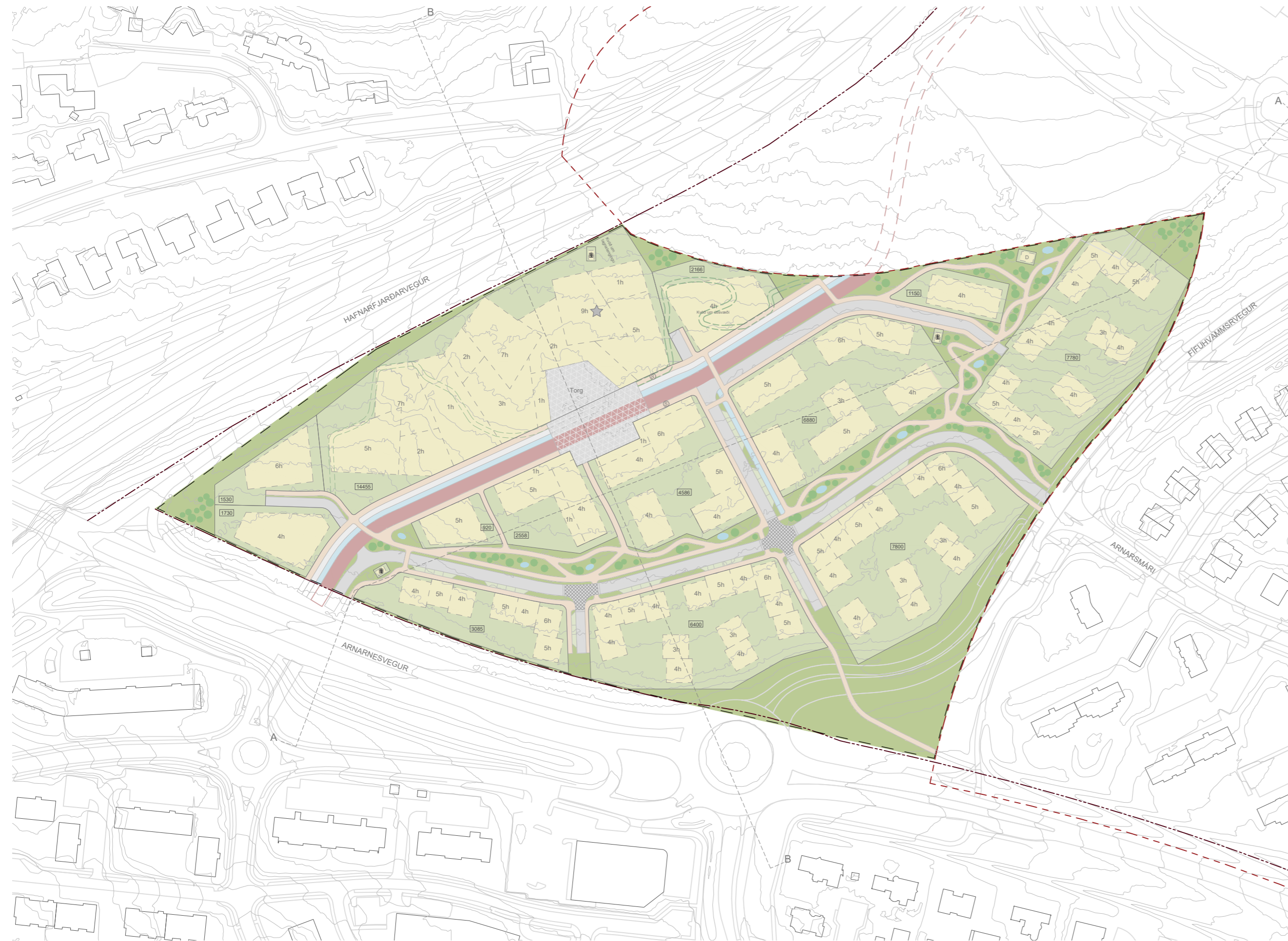
DEILISKIPULAGSUPPDRA'TTUR - MKV, 1 : 2000