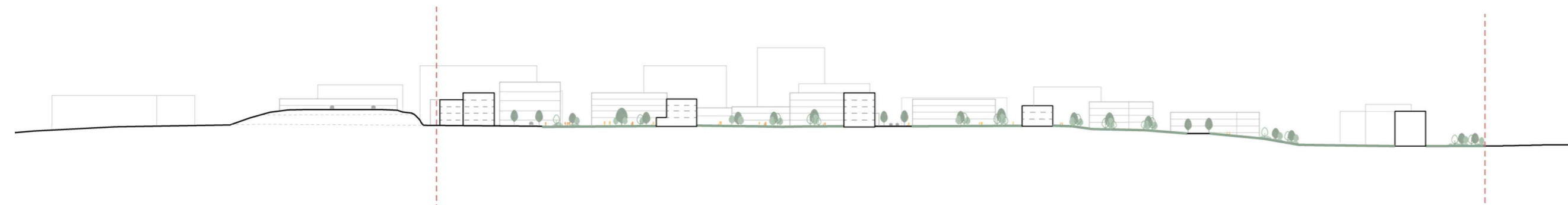
SNID AA - MKV, 1 : 2000