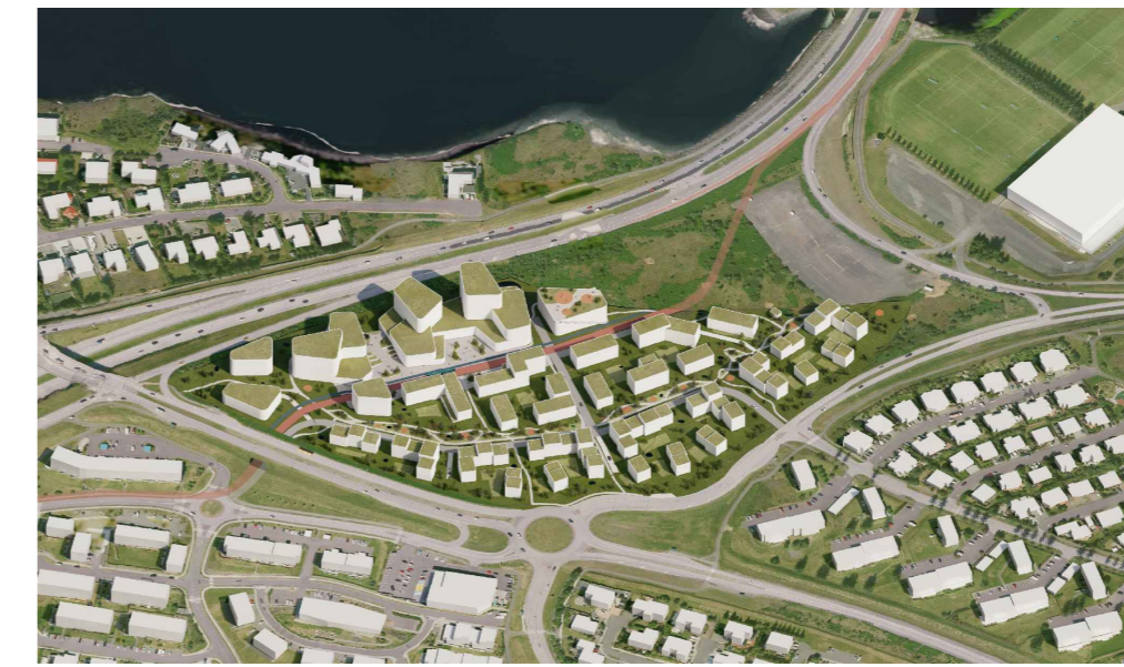
SKYRINGARMYND, HORFT TIL NORDURS