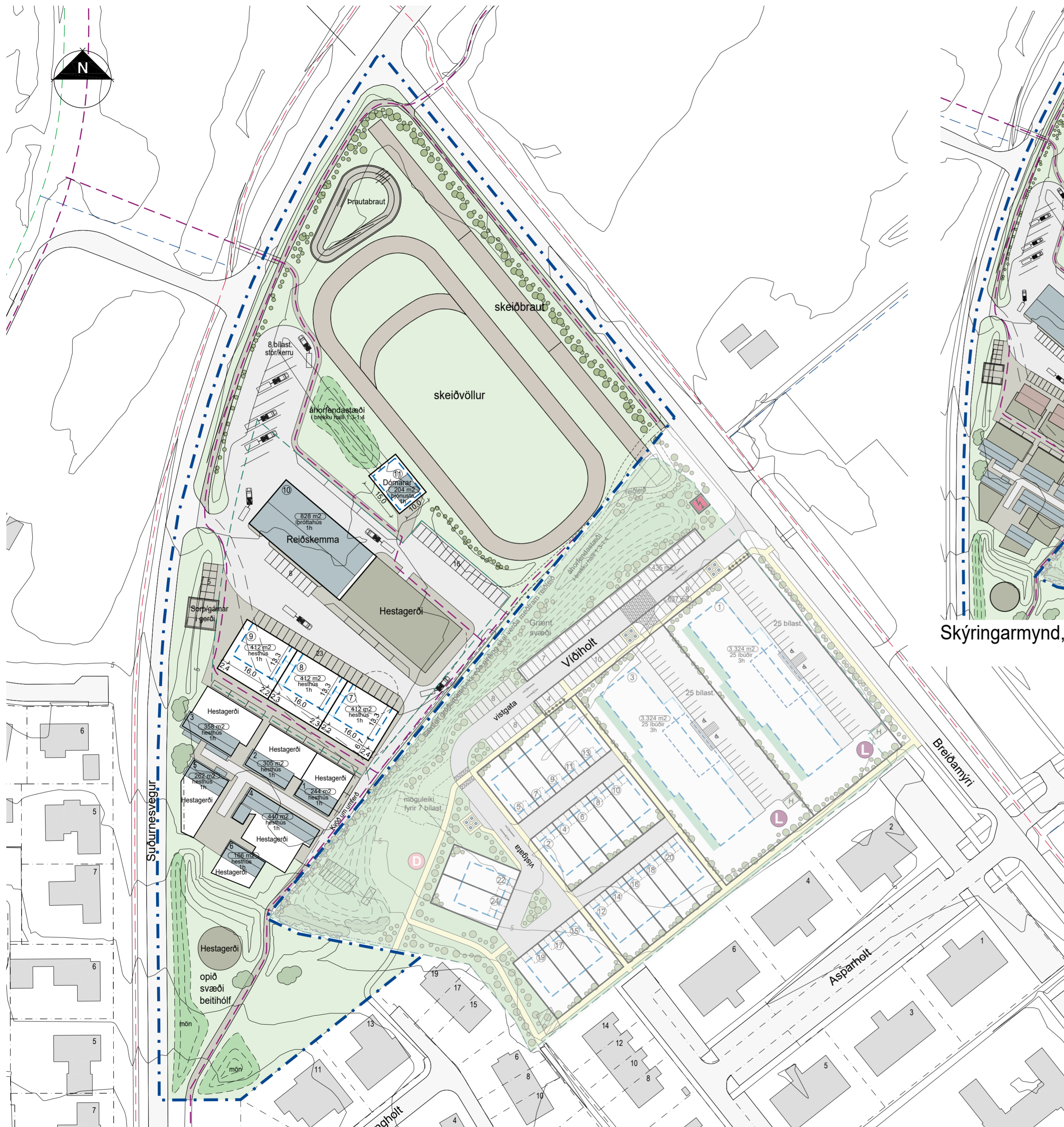
Deiliskipulagstillaga mkv. 1:1000