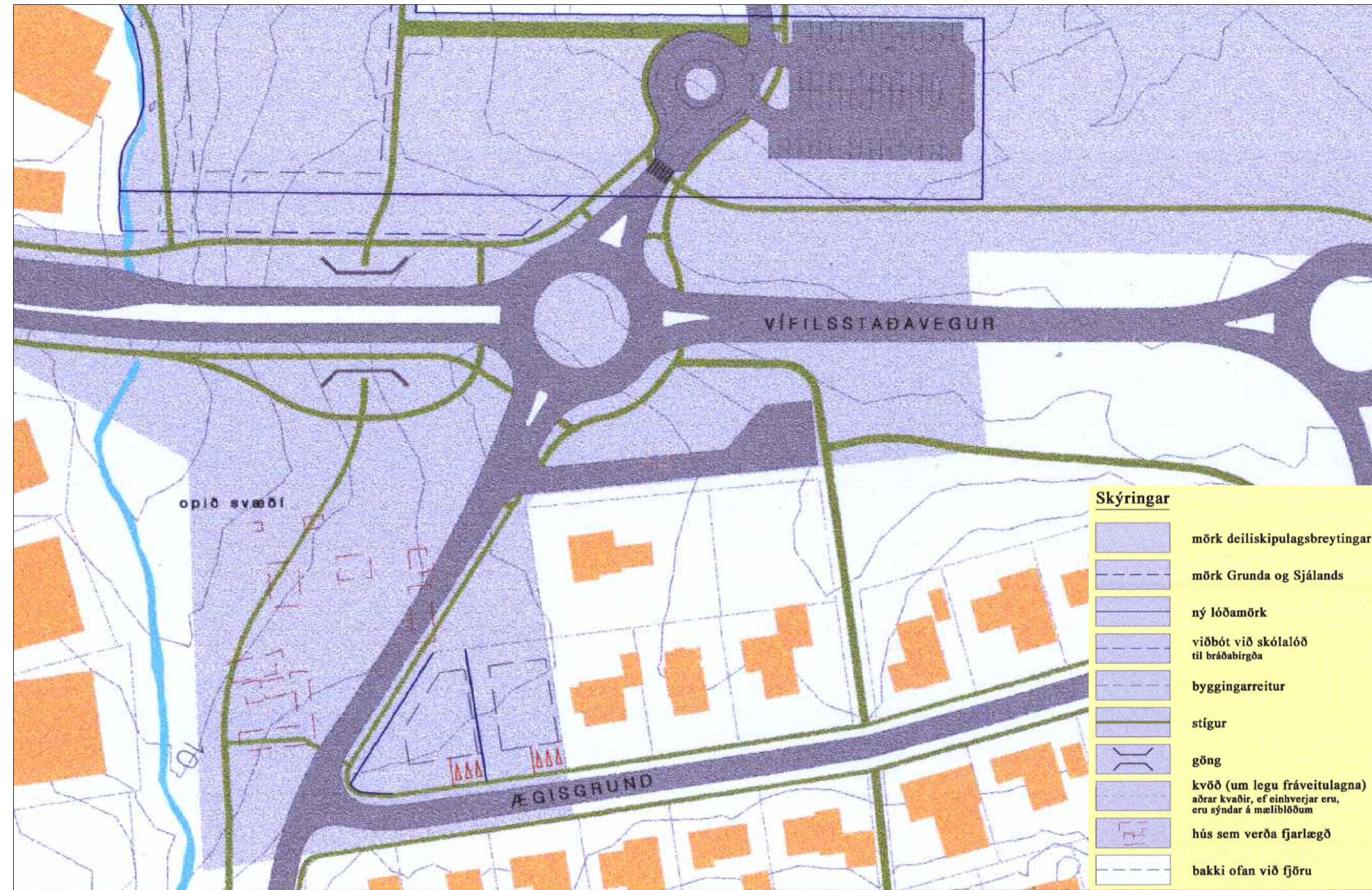
GILDANDI DEILISKIPULAG, SAMÞYKKT 01.04.2004 / AUGLÝST Í B-DEILD STJÓRNARTÍÐINDA 14.04.2004 MKV. 1:1000