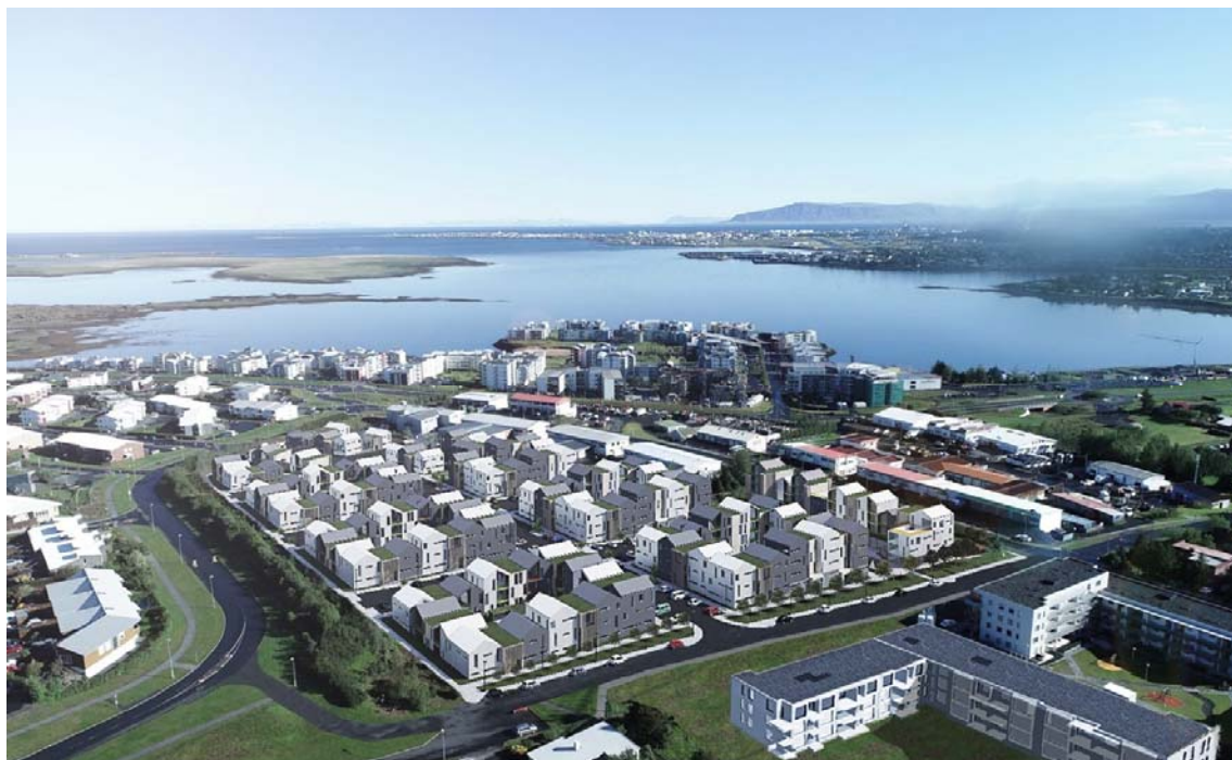
Mynd 7. Skipulagssvæðið úr suðaustri

Íbúðir á jarðhæð skulu hafa sérafnotarétt af lóð á jarðhæð garðmegin. Ef engin íbúð er á jarðhæð telst svæðið næst húsvegg vera sameign. Stærð þessa reita skal vera að minnsta kosti svalastærð efri hæða en mega að hámarki ná 4 metra frá útvegg húsa. Sérnotafletir skulu að lágmarki hafa 20% gróðurþekju.