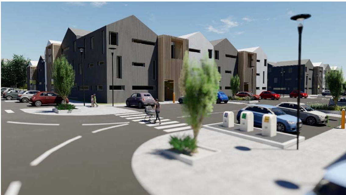
Mynd 4. Djúpgámar og rafhleðslustöðvar við götu.

Meginhugmynd deiliskipulagsins er að byggingar umlykja inngarða sem eru ýmist opnir að hluta eða alveg lokaðir en hafa þá opinn aðgang a.m.k. frá tveimur hliðum. Þannig skapast skjólsæl rými örugg fyrir yngstu íbúana og í næði frá bílum og umferð, með dvalar- og leiksvæðum. Í samræmi við rammaskipulagið, tengir græn gönguleið umhverfi Hraunsholtslækjar við nýjan leikskóla við Lyngás og áfram að leikskólanum Ásum við Bergás og græna geirann að baki hans. Stígurinn er í senn göngu- og hjólaleið auk þess sem hægt verður að bjóða upp á útivistartengd leik- og æfingarsvæði meðfram stígnum. Þar sem stígurinn þverar götur fær hann forgang bæði sem umferðarleið og í efnisvali.