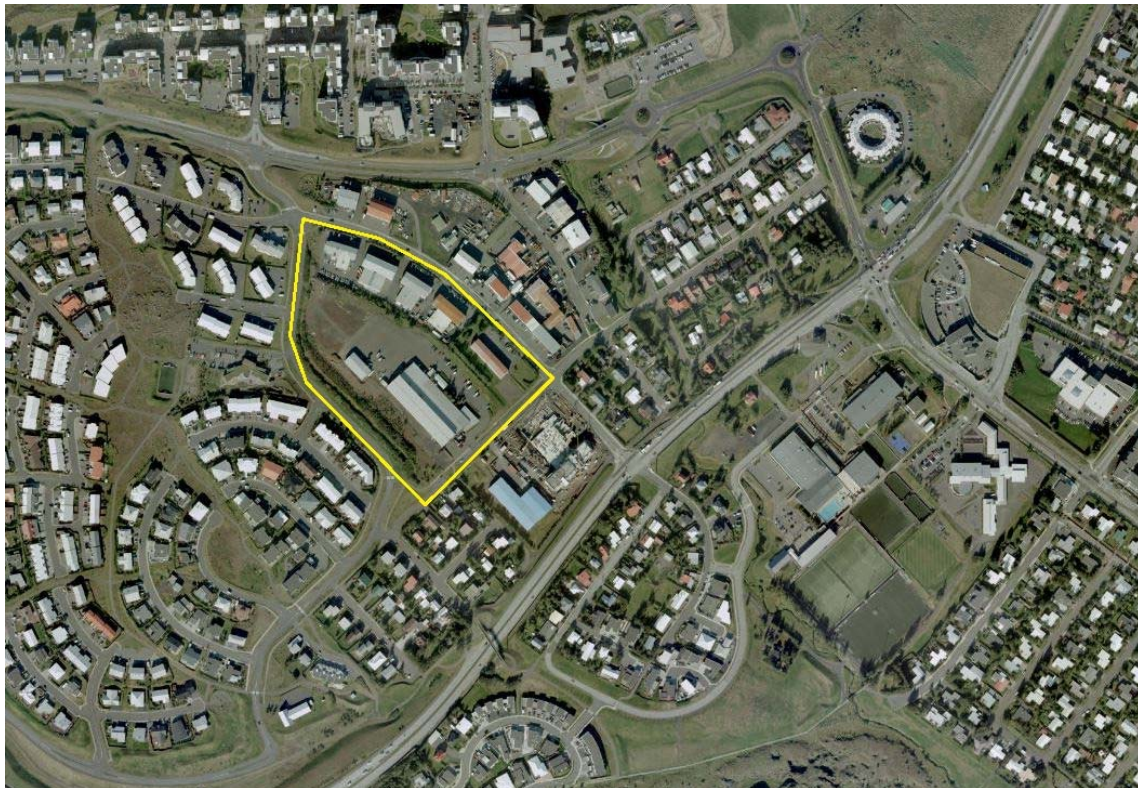
Mynd 1. Afmörkun skipulagssvæðisins.

Svæðið er miðlægt innan Garðabæjar og í nálægð við verslun og þjónustu. Stutt er í útivistarsvæði við Arnarnesvog, bæjargarð við Hraunsholtslæk og íþróttasvæði við Ásgarð. Deiliskipulagssvæðið er að mestu leyti athafnasvæði, ýmist malbikað, malarborið eða grassvæði með lágum trjágróðri þar sem fyrir eru iðnaðar- og skrifstofubyggingar.