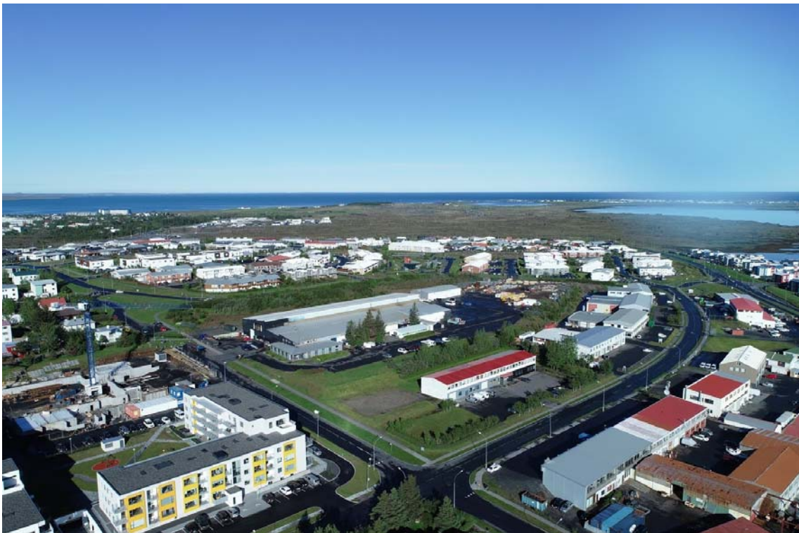
Mynd 2. Núverandi ásjúnd skipulagssvæðis.

Markmið deiliskipulagsins er að skapa hagkvæmar íbúðir sem ætlað er að höfða sérstaklega til yngra fólks. Meðal leiða til að ná þessu markmiði verða m.a. sameignarrými í lokunarflokki A skv. skráningartöflu, í algjöru lágmarki og engir bílakjallarar verða í byggingum við Eskiás, heldur verða húsagötur nýttar til að þjóna stæðum sem liggja 90 gráður á legu gatna. Bílastæði eru skv rammaskipulagi 1,2 stæði á íbúð. Á þessu svæði verða kjallarar eingöngu fyrir hjóla- og vagnageymslur auk þess í einhverjum tilfellum að hýsa geymslur tilheyrandi íbúðum. Nýjar byggingar við Lyngás verða með bílakjöllurum.