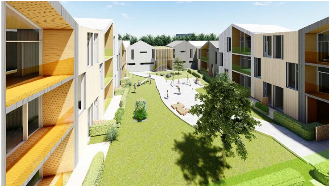
Mynd 6. Inngarður