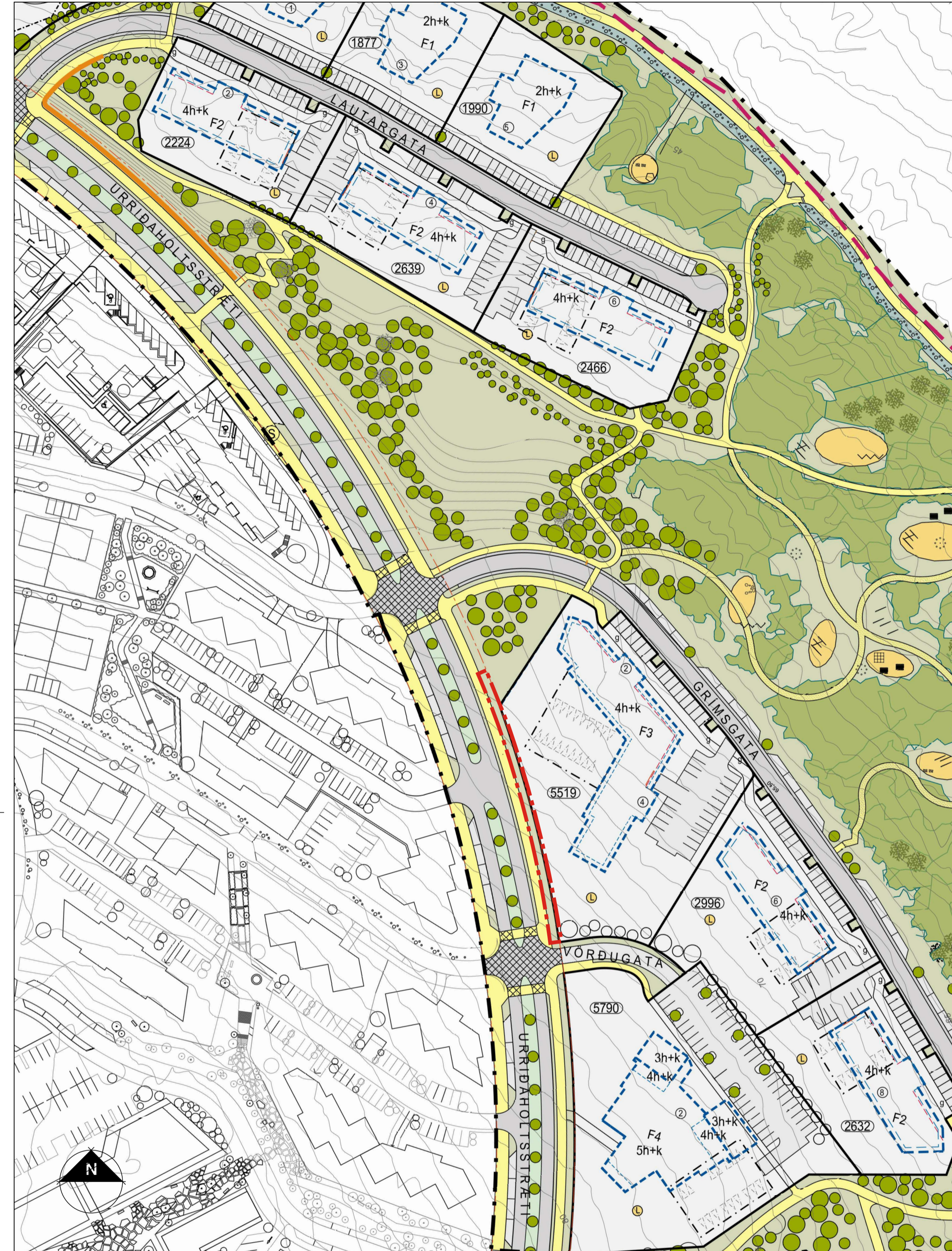
Gilandi deiliskipulag Urriðaholts 4. áfanga norðurhluta samþykkt í Bjarstjóm 18.03.2021