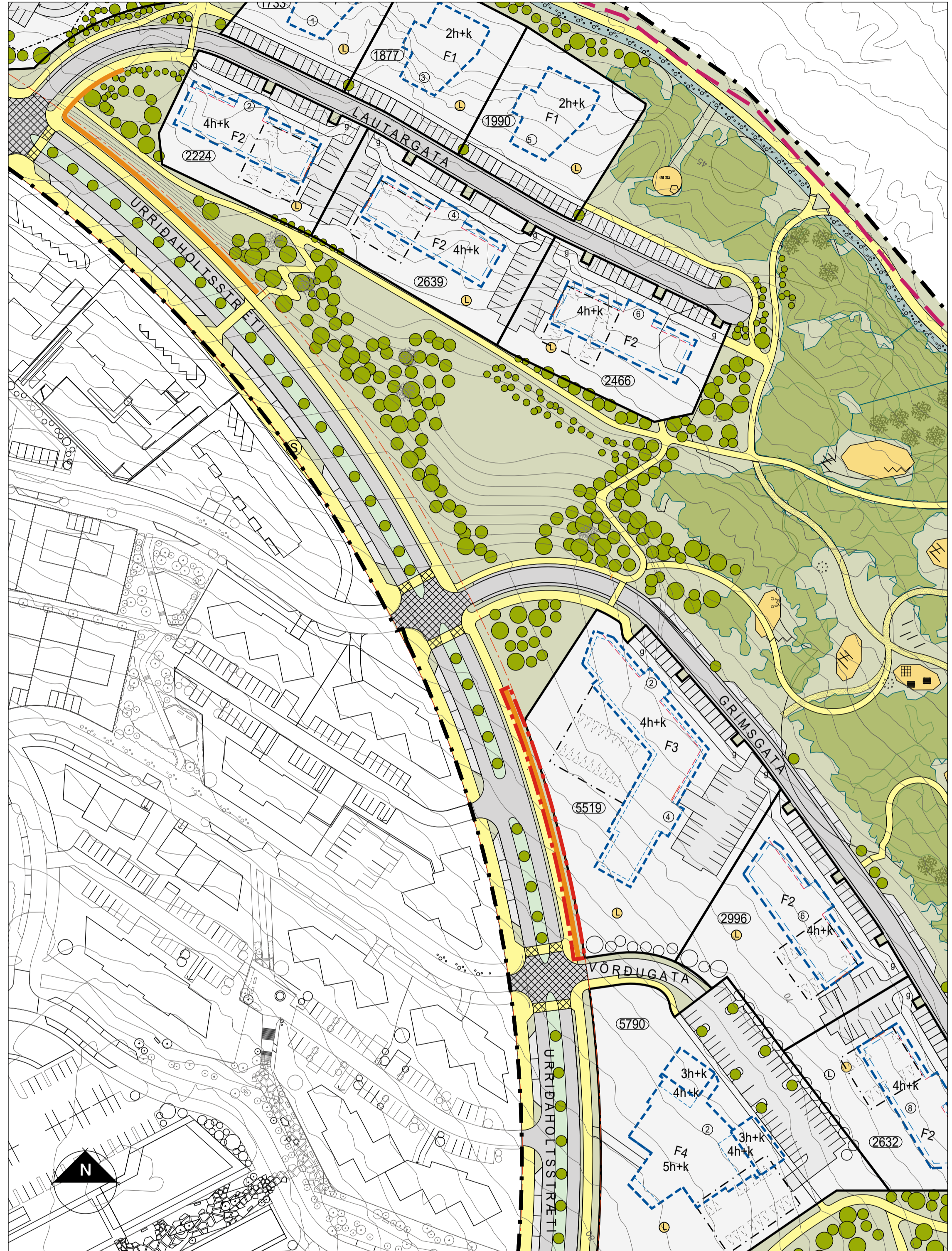
Tillaga að breytingu á deiliskipulagi