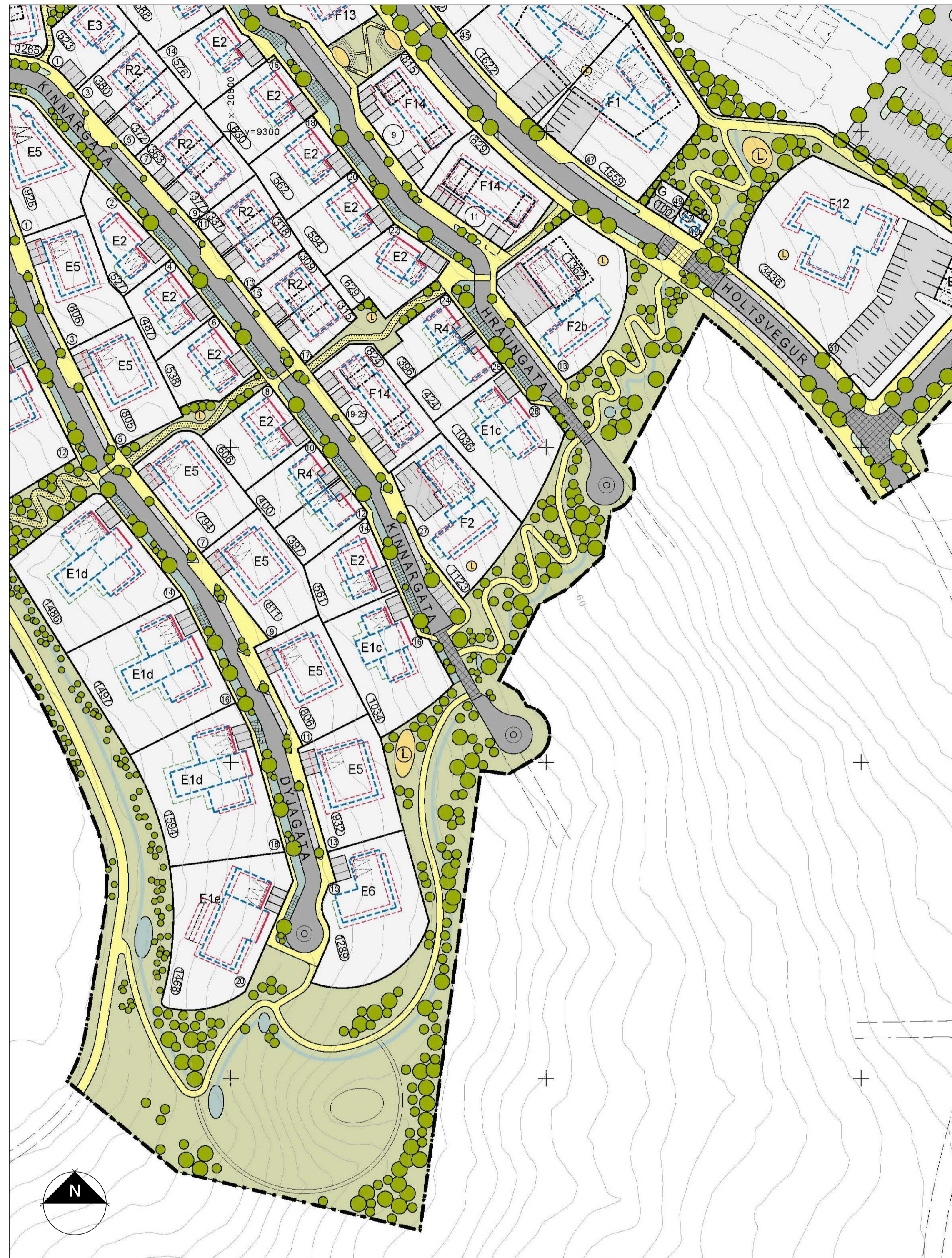
Gildandi deiliskipulag vesturhluta Urriðaholts samþykkt í bæjarstjórn 16.08.2007 með síðari breytingum