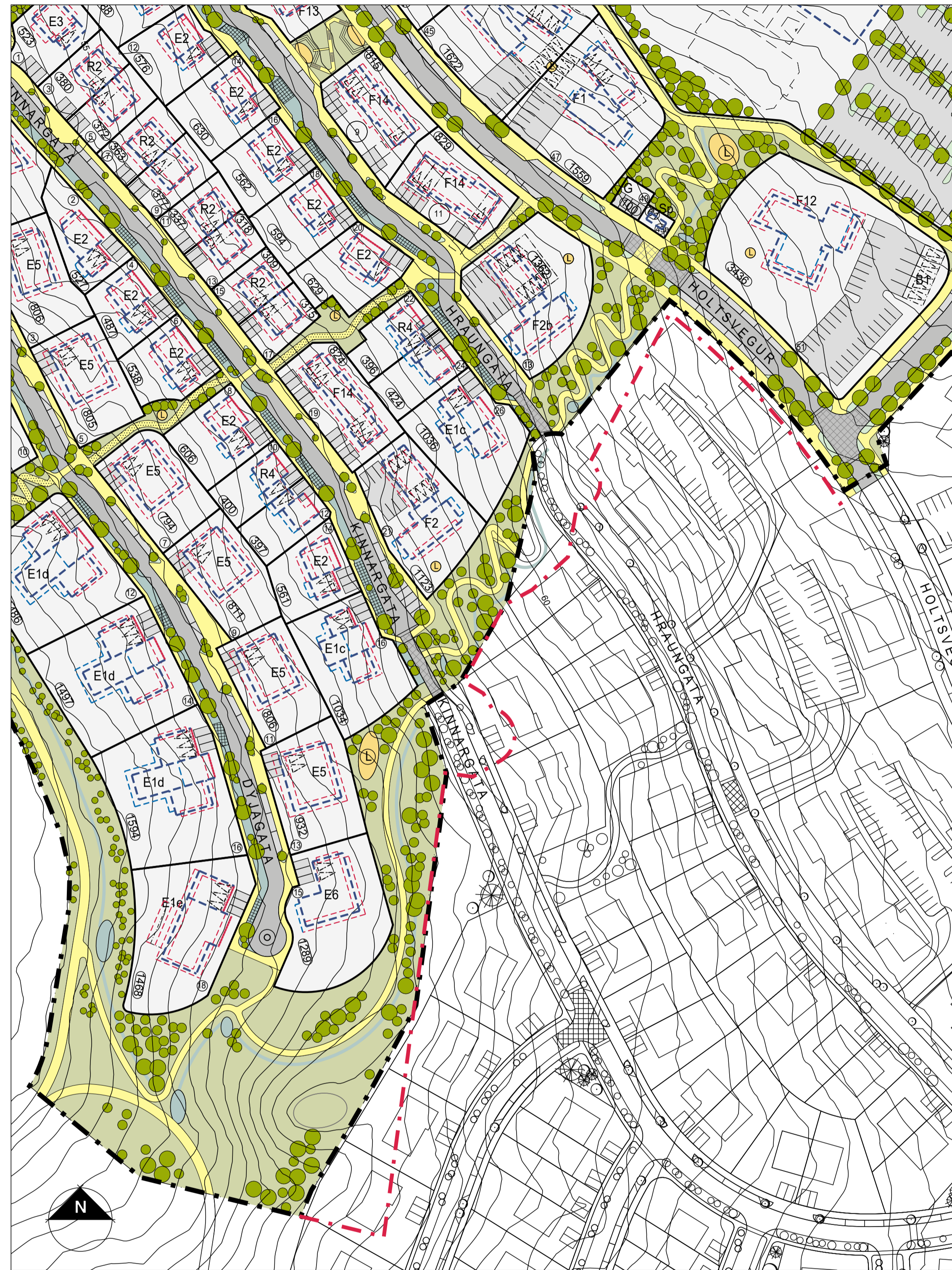
Tillaga að breytingu á deiliskipulagi